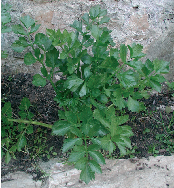
Apium graveolens L.

NOTE E CURIOSITÀ: il nome scientifico aggiornato è P. crispus (Mill.) Fuss.