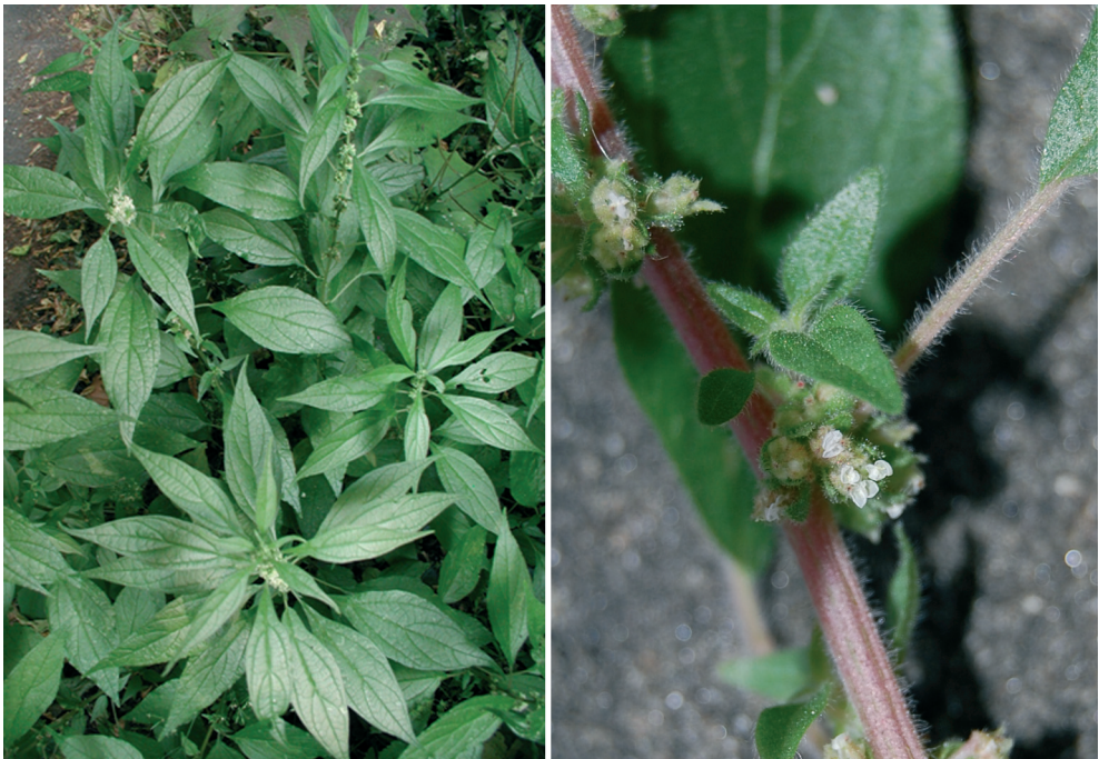
A sx, pianta in fioritura e a dx, particolare dei fiori

DOMESTICI: l'intera pianta è usata per pulire le bottiglie o più in generale gli oggetti di vetro.