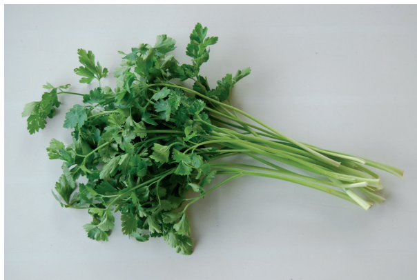
Petroselinum sativum Hoffm.